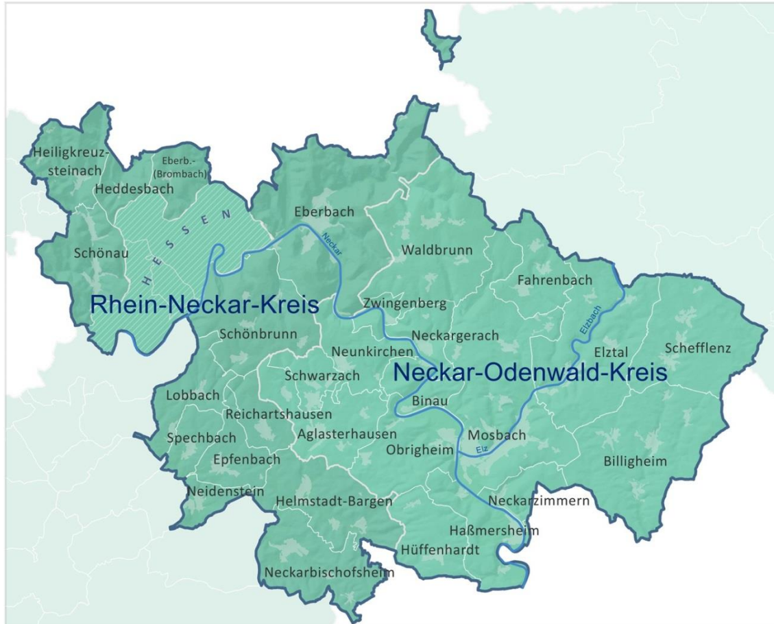
Die Region Neckartal-Odenwald aktiv

Weitere Informationen finden Sie in der Interessenbekundung zur Bewerbung als LEADER-Region, die dieser Ausschreibung beigelegt sind.